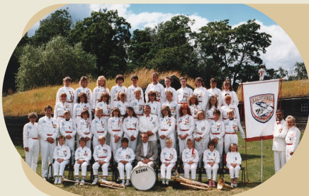
Tekst og bilder: Aina Sundfær